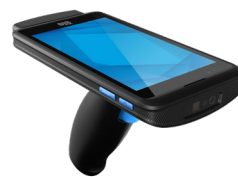
トリガーハンドル (E393015)