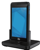
ドッキングステーション (E864066)