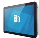
屋外用 タッチモニター