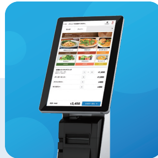
デモ スマレジ・券売機