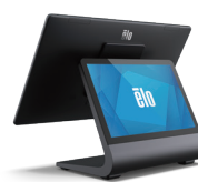
Windows タッチコンピューター (POS 用途)