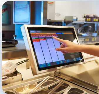
デモ キッチンディスプレイ／オーダーエントリー