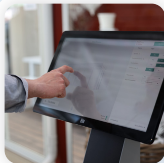
デモ 待ち行列管理システム (受付機)