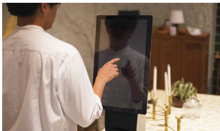
セルフチェックイン機