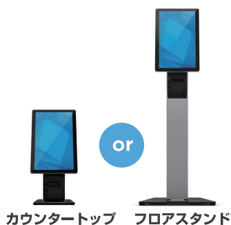
カウンタートップ フロアスタンド