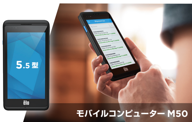
モバイルコンピューター M50