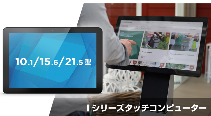
I シリーズタッチコンピューター

Android OSを搭載したタッチコンピューターやモバイルコンピューターに加え、Androidコンピューターボックスを様々なサイズのタッチモニターに接続すれば、幅広い製品上で EloView を利用できます。